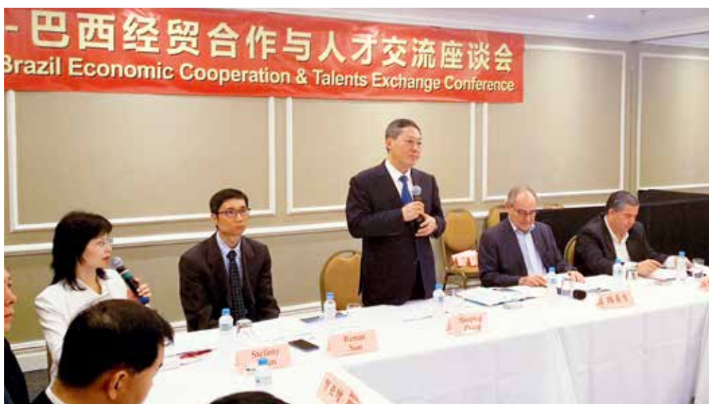
烟台—巴西经贸合作与人才交流座谈会会场

2018年10月11—20日，烟台市委书记张术平率烟台代表团到巴西、阿根廷、南非等国家，进行经贸考察和友好访问，广泛接触当地政府、议会、企业、商会、华侨华人团体及驻外使领馆，举办3场经贸合作和人才交流洽谈会，宣传烟台发展成就，推介烟台市投资贸易环境和“双招双引”政策。