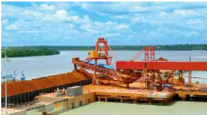
几内亚博凯内港码头

【烟台港集团概况】2018 年末,烟台港集团有限公司拥有芝罘湾、西港区、龙口港、蓬莱港四大港区,形成以芝罘湾、西港区、龙口港、蓬莱港为依托,以莱州华电码头、朱旺码头、潍坊寿光港、东营广利港、滨州套尔河港为支撑,以几内亚博凯内港为海外延伸桥头堡的布局合理、功能协调、优势互补的港口集群新格局。