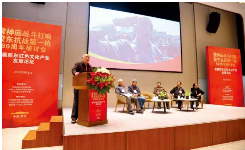
2018年3月1日,“雷神庙战斗打响胶东抗战第一枪80周年研讨会暨首届胶东红色文化产业发展论坛”在牟平举行。图为发言嘉宾追忆父辈革命故事。

【社会生活】城镇居民人均可支配收入43631元,增长7.1%;人均消费性支出30284元,增长6.2%;人均住房建筑面积34平方米。农村居民人均可支配收入20023元,增长7.3%;人均消费支出14754元,增长5%;人均住房面积65平方米。全区城镇基本养老、医疗、失业、工伤和生育保险参保人数分别达到32.09万人、40.5万人、5.42万人、5.43万人和5.4万人。企业养老保险参保人数9.65万人,机关事业单位养老保险参保人数1.74万人,城乡居民养老保险参保20.7万人,全区城乡最低生活保障救助6801人。其中,城镇低保339人,农村低保6462人,农村特困救济1133人。全区各类养老服务机构和设施21个,各类养老床位2094张。