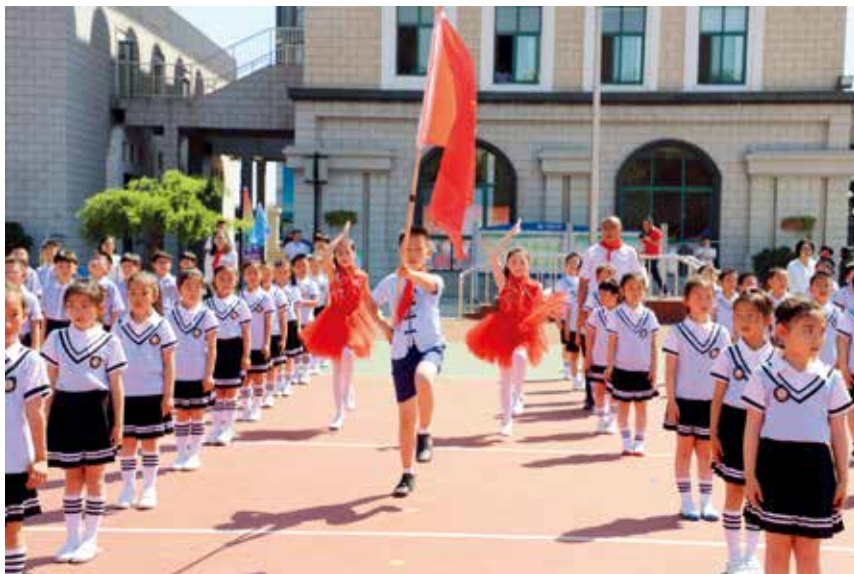
2018年6月1日，团市委举办“争做新时代好队员——你好，新时代”主题队日暨“红色基因 我们传承”展演活动。

【服务中心工作】团市委开展“经贸考察烟台行”活动，实施“青春引智”计划，发挥驻烟高校、科研院所等青年专家智力优势，组成企业青年专家服务团、社区青年医疗专家顾问团和大学生青春建功实践团，推动烟台大学与烟台持久钟表集团有限公司等9家企业签订合作协议。融入乡村振兴战略，以农村青年创业致富“领头雁”培养计划为统揽，开展“村村都有好青年”评选，以返乡创业青年为重点，培养一批参与实施乡村振兴战