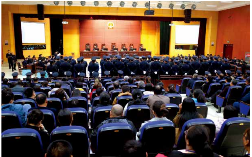
2018 年 11 月 20—27 日，莱州市人民法院一审公开审理省扫黑办挂牌督办的 31 名被告人涉黑案。

【法治建设】 审结一审行政诉讼案件 734 件，审查非诉行政执行案件 1567 件。落实行政案件跨区域管辖，赋予当事人对一审行政诉讼案件管辖的适当选择权，保护当事人诉权。推动行政争议实质性化解，与政府共建行政争议审前和解中心，39 起复杂案件在审前化解；对涉及土地征用、房屋拆迁等领域纠纷加大协调力度，经协调和解撤诉 167 件。强化司法和行政良性互动，定期召开联席会议，发布行政审判白皮书，联合相关部门举办法制培训 36 场次，针对工伤认定、环境保护等提出司法建议 81 篇。落实“谁执法谁普法”责任，常态化开展“法德共进”、以案释法、新闻发布等工作，建设全国首家行政诉讼教