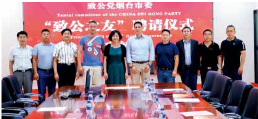
2018年7月13日，致公党烟台市委邀请在中国访问的匈牙利商贸及友好侨团代表团到烟台考察访问，并举行“致公之友”聘请仪式。

元购置2辆校车，满足观水镇埠西头小学上下学需求；连续第三年开展“冬日暖阳”活动，为崇文中学的近百名贫困优秀生捐赠价值5万元的棉衣，出资协办“感动崇文2017年度人物评选”活动；为莱阳特殊教育学校捐赠2万元服装和体育用品，捐赠3.9万元结队帮扶8位困难学生。全年，市委会及各级组织开展服务培训类社会服务活动110余次，参与党员120人次，受惠群众达5200人次；开展公益慈善类社会服务活动70余次，参与党员280多人次，捐款捐物240多万元。