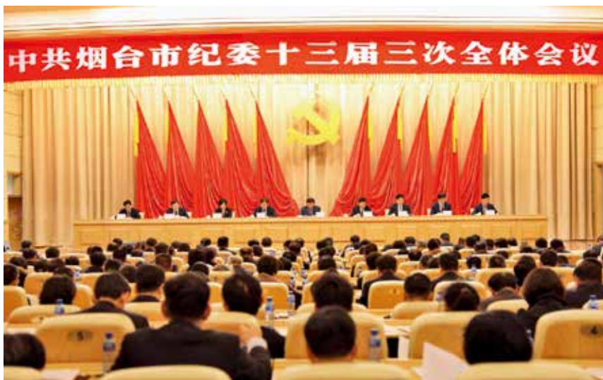
2018 年 1 月 21 日，中国共产党烟台市第十三届纪律检查委员会第三次全体会议召开。