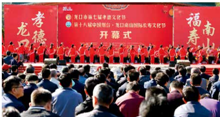
2018 年 10 月 17 日，龙口市第七届孝德文化节暨第十八届中国烟台·龙口南山国际长寿文化节在南山景区华严世界广场开幕。

名的高速公路——龙青高速实现真正意义上的全线贯通。龙青高速全程 156.7 公里，双向四车道，设计时速 120 公里。其中，龙口至莱西段全长 66.8 公里，该路段经龙口、招远、莱西三市，终点接莱西至城阳段，通过高速公路网与青岛港、青岛机场连通。