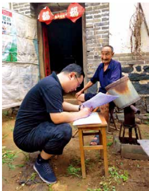
2018年7月25日，市扶贫办工作人员在栖霞市观里镇驻镇走访。

【“332”集中攻坚】 烟台市确定海阳、莱阳、栖霞和30个镇、200个村为全市脱贫攻坚重点县镇村。选派236名后备干部和优秀年轻干部到6个县市区政府挂任副职、30个扶贫工作重点镇党委挂任副书记、200个