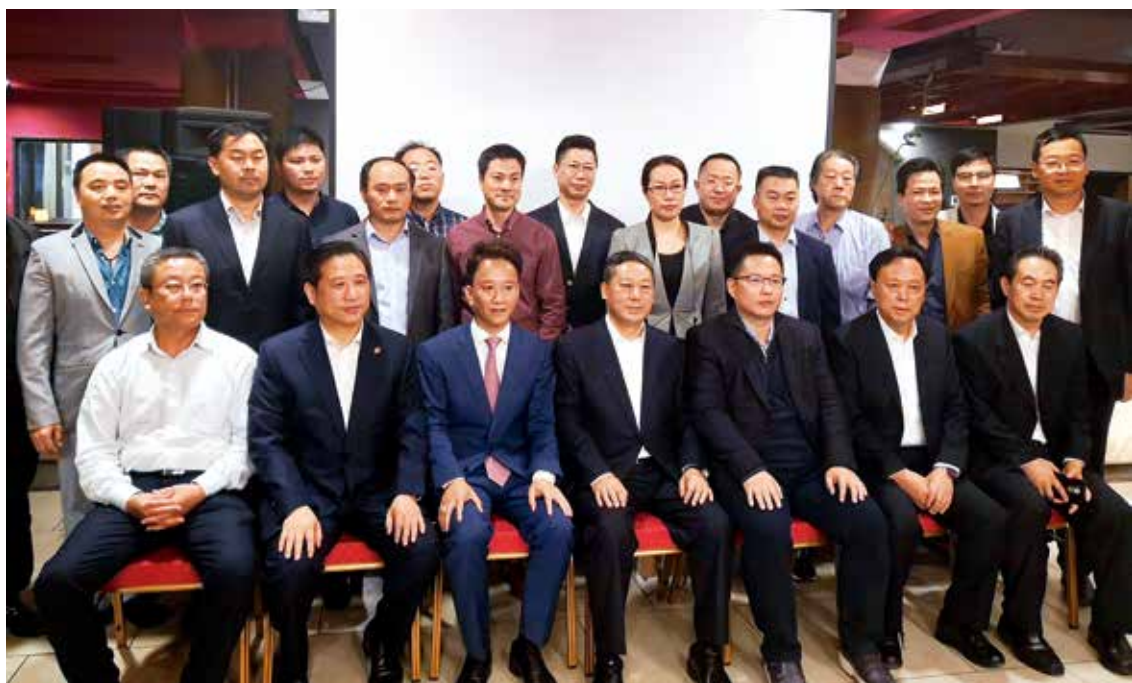
烟台市领导与阿根廷华人企业家合影