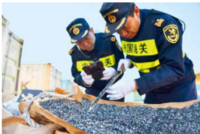
2018年12月17日，烟台海关查获走私进口废旧塑料。

【口岸安全把关】 与烟台市畜牧局等部门联防联控，加强对旅客携带物、邮寄物、快件、运输工具、集装箱等检疫查验，组织开展非洲猪瘟疫情知识和防控措施专项培训，坚决防范非洲猪瘟疫情传入传出。完成新西兰进境 3297 头新西兰种牛的监管工作。