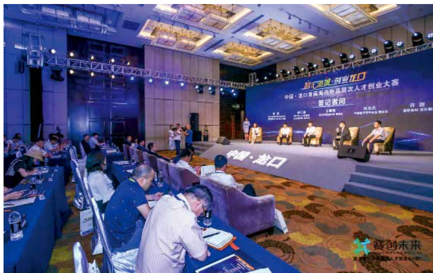
2018 年 7 月，“智汇港城·创业龙口”中国·龙口首届海内外高层次人才创业大赛在上海启动。

【社会生活】 城镇居民人均可支配收入 48174 元，增长 7%；人均消费性支出 30474 元，增长 4.1%；城镇人均住房建筑面积 43.96 平方米。城镇非私营在岗职工年平均工资 67769 元，增长 5.6%。农村居民人均可支配收入 22034 元，增长 7.2%；农村人均生活消费支出 15018 元，增长 6.5%；农村人均住房面积 59.83 平方