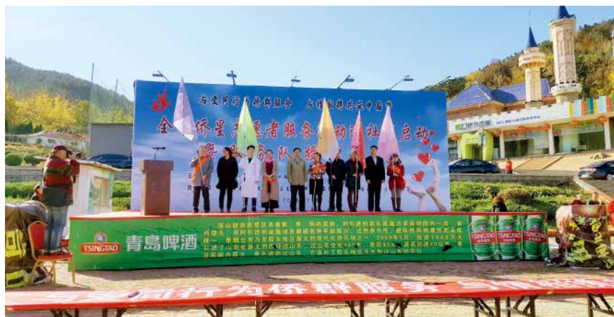
2018年11月7日，烟台市侨星志愿者服务活动进社区启动暨服务队授旗仪式在塔山游乐城举行。

【基层组织建设】 市残联规范完善组织架构和工作队伍，开展残疾人组织建设“强基育人”工程自查，市县两