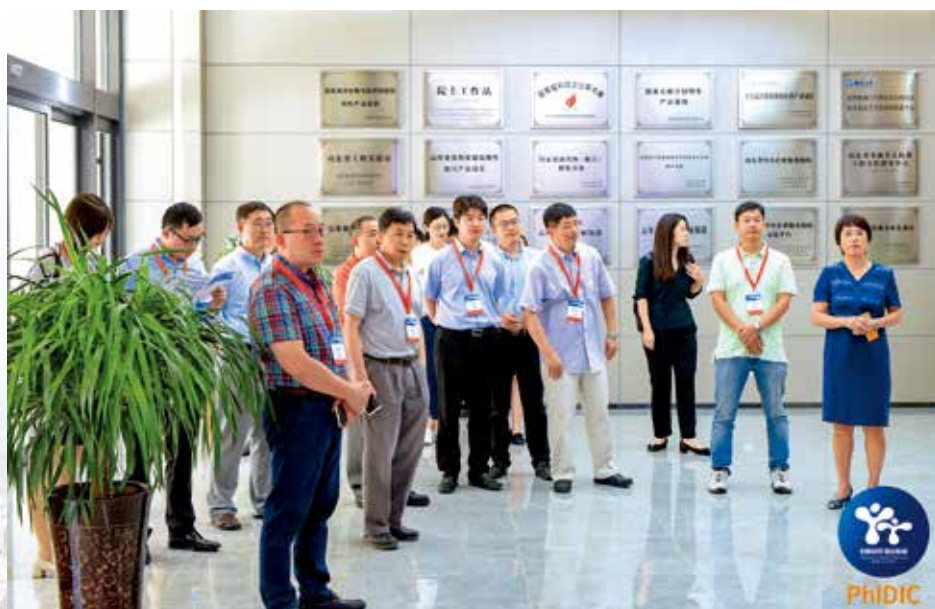
参会代表现场观摩烟台医药与健康公共技术服务平台