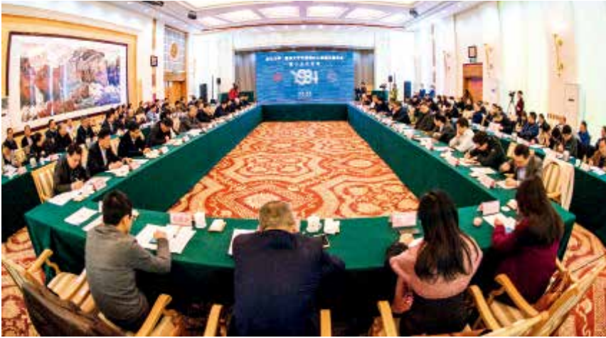
2018年11月17日，北京大学、清华大学支援烟台大学建设第十三次会议召开。