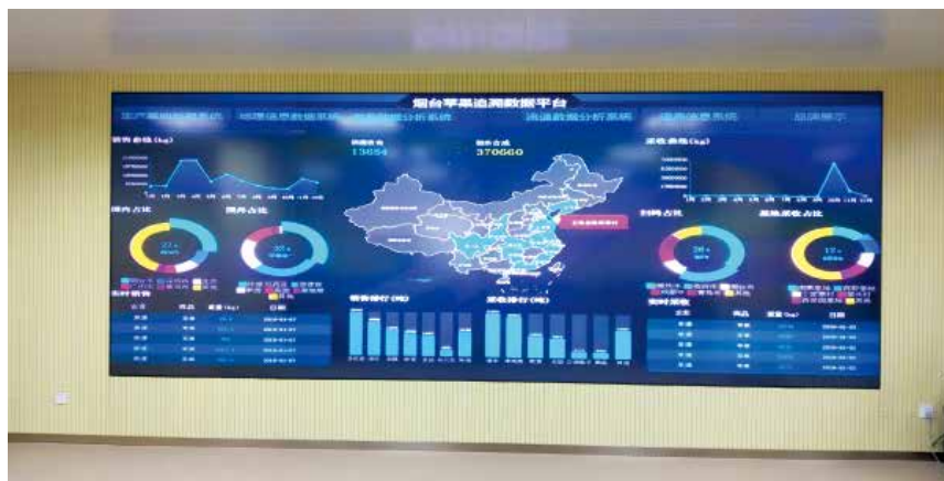
烟台苹果追溯数据平台

【市场运行监测】 市商务局优化精简 2018 年《市场运行监测工作绩效考核办法》，召开 3 次培训会议，对