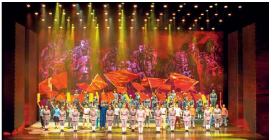
2018年10月,大型音乐舞蹈史诗《英雄胶东》演出。

【烟台首届文化惠民消费季】 4—10月,举办第二届烟台文化惠民消费季,全市92家企业参与活动,在齐鲁文惠购平台建立网点141家,上传文化产品3万余件次,形成订单9.01万件。配合消费季开展艺术精品欣赏、新兴时尚采摘等6大主题百余场文化惠民消费活动。全市投入文化惠民消费引导资金500万元,发放文化惠民消费券450万元,实际使用448万元,直接拉动文化消费1308万元,带动全市文化消费2250万元。全市有111家企业通过省级消费季活动审核,有48家企业与省厅签约,数量居全省前列;全市9个县市区落实县域文化惠民消费引导资金,开展当地的文化惠民消费季工作,数量居全省首位。