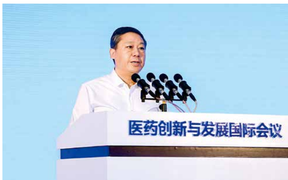
市委书记张术平在会上致辞

2018年9月7—8日，2018医药创新与发展国际会议在烟台市举办，来自国家工信部、科技部、卫健委等部门20余名领导和200余名医药领域知名专家学者与会。国家“千人计划”专家联谊会生物医药与生命科学专委会同期举办专委会年会，并举行“慧聚烟台”千人计划医药健康产才融合推介活动，参会“千人计划”专家突破百名。会议期间，29个产业、投资及人才合作项目进行集中签约，总投资额约90亿元。