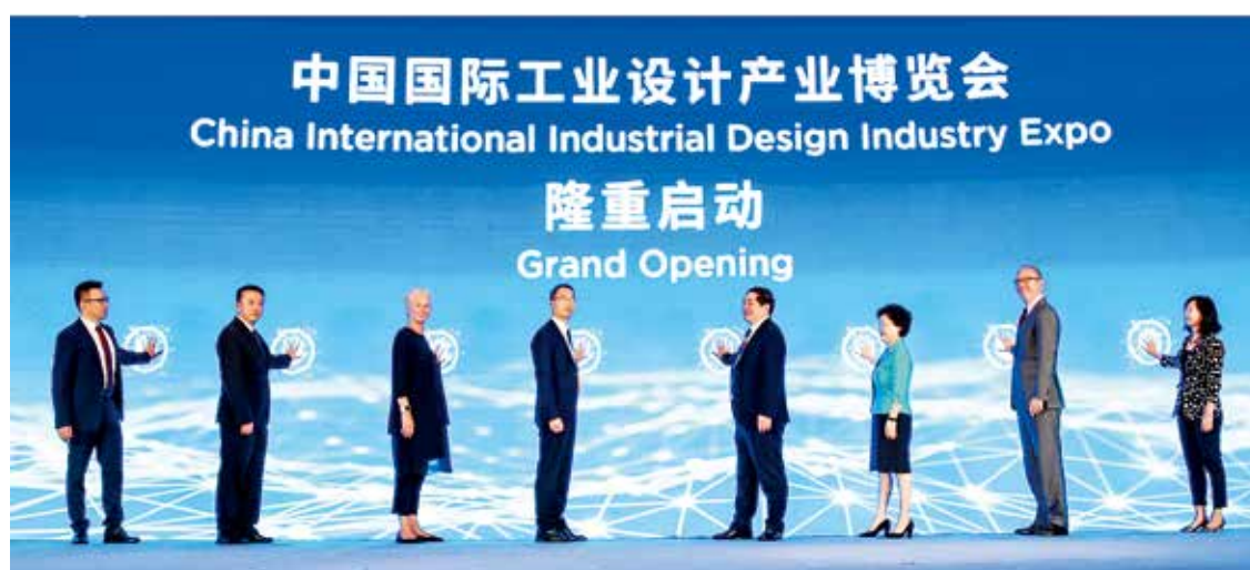
中国国际工业设计产业博览会启动仪式