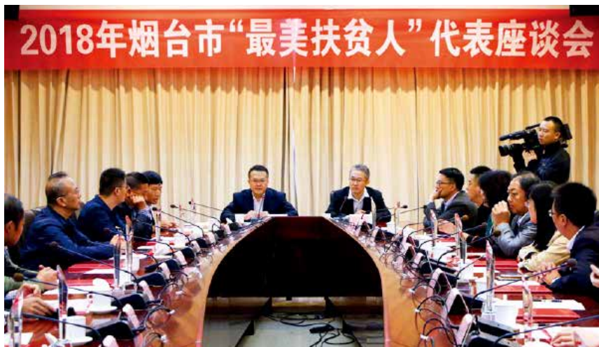
2018 年 10 月 16 日,召开 2018 年烟台市“最美扶贫人”代表座谈会。

【对台经济工作】 促成 14 个经贸团组赴台,集中发力推动相关项目落地。推动华新丽华集团增资 2.19 亿美元在开发区打造全国首个新型智能化不锈钢 4.0 生产基地建设;协调推进富士康集团烟台园区改造升级,搭建双向工业互联网智能制造平台;推动莱州强信机械有限公司转型升级,建设数控设备制造、缝纫机上下游产业、零部件加工、医疗器械加工及物流园区为一体的高端设备制造业产业区;推动富士康烟台工业园与 5 家台资企业合作,成立烟台市海峡两岸教育创新基地,打造集教学装备、解决方案、售后服务、教育产业孵化的教育平台。