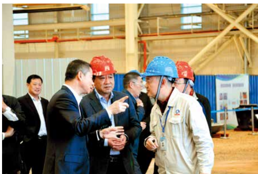
工信部副部长辛国斌视 察台海集团核电装备模块化 制造项目