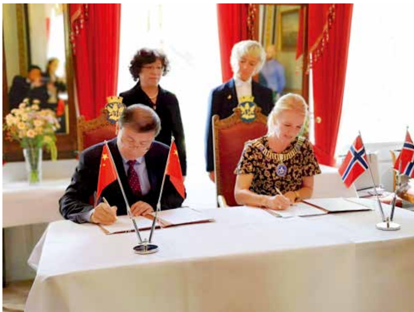
2018年9月22日,烟台市与挪威斯塔万格市正式缔结国际友好合作城市关系。

【涉外服务】 市外侨办从严从实从细做好涉朝涉韩有关问题、涉外渔业管控、“一带一路”沿线投资企业风险摸排防控等工作,全年没有发生一起政治或涉外问题。落实全市涉外突发事件应急预案,妥善处理开发区瑞枫奥赛斯公司葡萄园土地征收案等涉外案件18起。依靠外交部领保中心、驻外使领馆等平台,打造烟台市“海