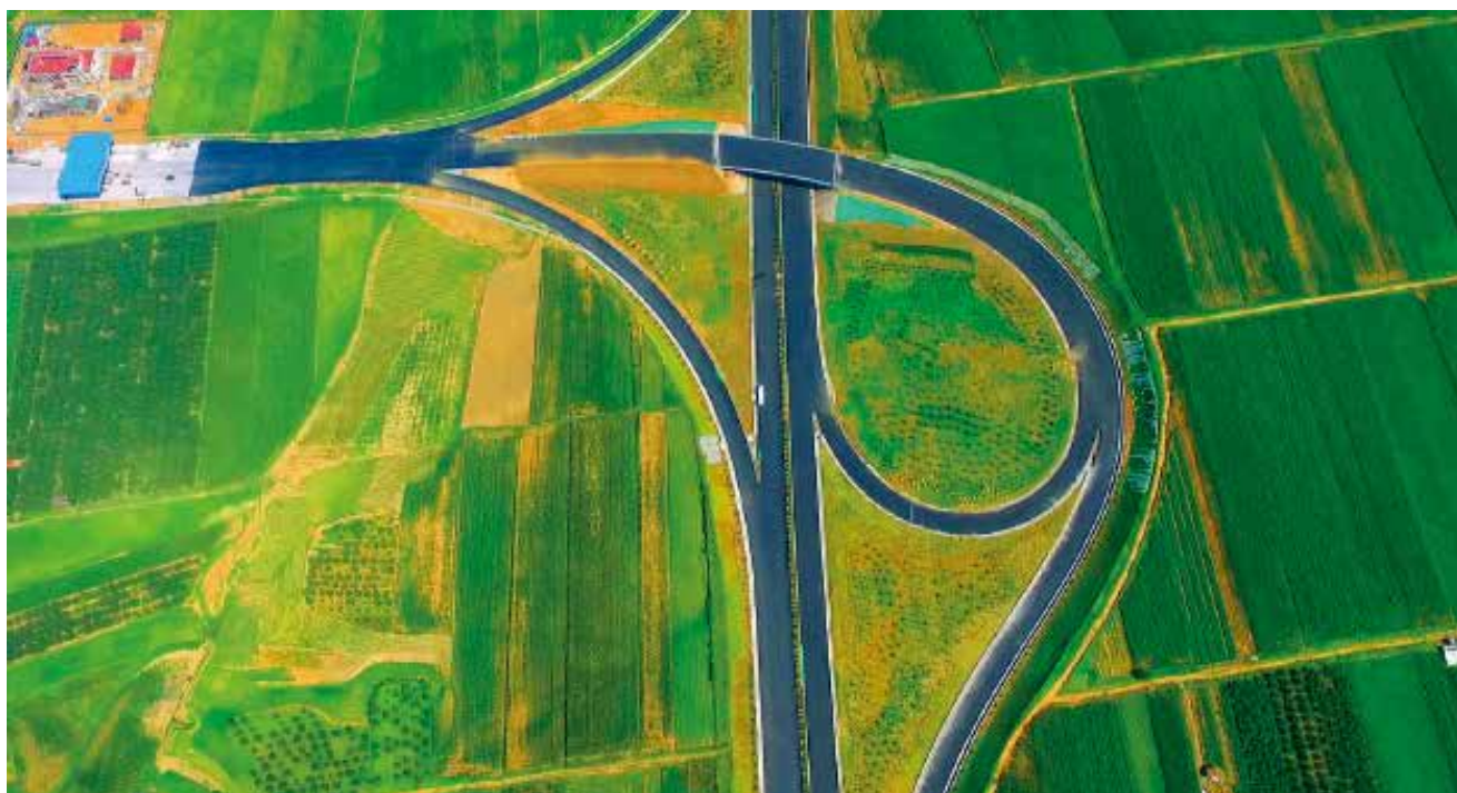
2018年9月28日，龙青高速龙口至莱西段通车。图为部分路段鸟瞰。

【场站建设】山东济铁烟台物流园一期工程建成并投入使用，莱山区公交调度中心及公交场站完成一期工程主体建设，海阳市公交客运枢纽场站正加快推进，长岛客运场站及枢纽建设项目列入交通运输部“十三五”客运枢纽项目库。