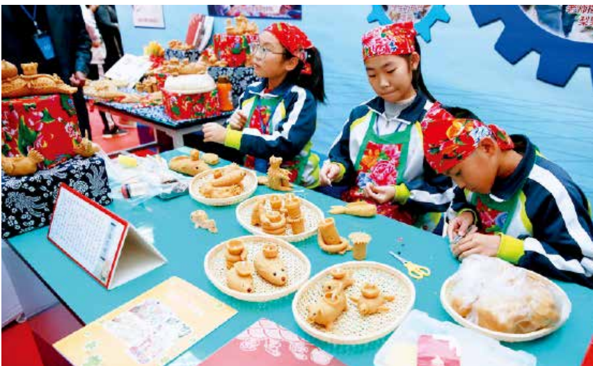
2018年10月27日，在烟台首届多彩实践节上莱阳市盛隆小学学生制作豆面灯碗。

【教育扶贫】 认定建档立卡困难家庭学生2790人，全部落实各项资助政策。为1229名贫困大学生办理生源地贷款，贷款金额1040.6万元。发