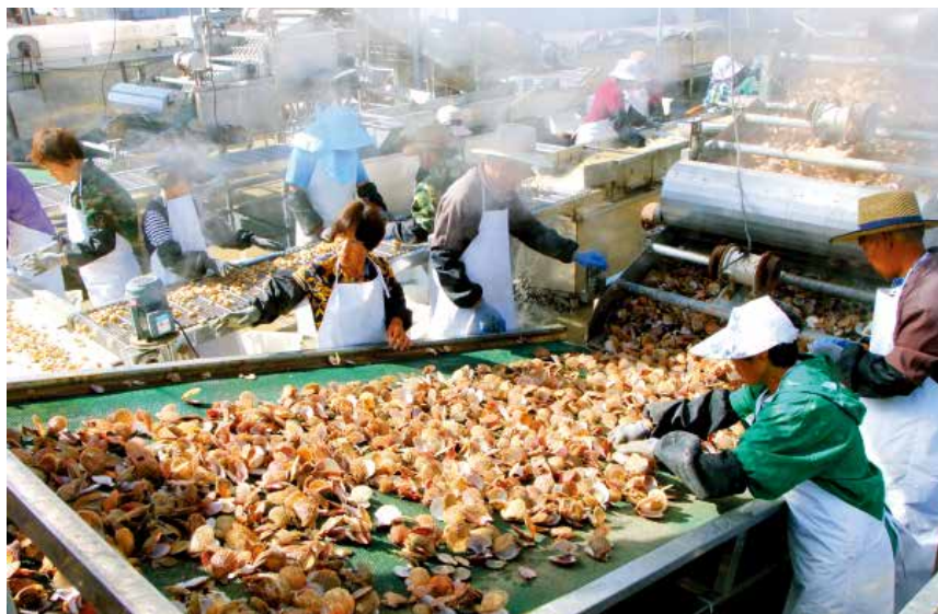
长岛县北城村渔业专业合作社机械化加工扇贝

5月31日，烟台市台办牵头、长岛县台办和妈祖文化交流协会联合邀请台湾8家友好宫庙到长岛开展妈祖文化交流。由台湾北港朝天宫、桃园慈护宫、台中乐成宫等39位代表组成的妈祖文化交流参访团前往显应宫祭拜妈祖。