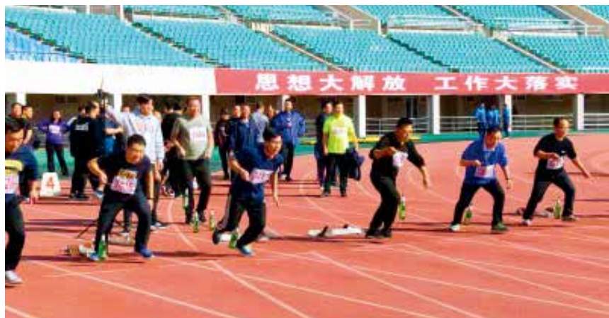
2018年10月24日,烟台市直机关第十五届运动会举办。

机关“作风大改进”工作。开展“转变作风 助推高质量发展”建言献策意见征集活动。在胶东在线网站、水母网网站开设专栏,面向社会征集推动烟台高质量发展的意见和建议,征集到意见建议30余条。向“网上民声”平台上月回复率不到90%的18个单位发放工作督办函,要求全面排查整改。开展“亮承诺、比奉献、树形象”活动。市直机关80多个直属党组织5600余名党员公开亮出庄严承诺,开展岗位练兵、技术比武和业务培训等活动80余项,设立“党员示范岗”1200余个。深化“两条渠道”听取群众意见活动,深化“民生热线”活动,全年民生热线节目播出313期,接听听众热线3200多个,问题回复率100%,处结率达97%以上;深化“网上民声”活动,全年收到网民有效留言近7万余条,其中内参留言1800多条,总体回复率98.21%。贯彻落实市委书记张术平对“两条渠道”活动的重要指示精神,与市委宣传部联合下发《关于进一步深化民生热线、网上民声活动的通知》,对“两条渠道”的回复时限、解决实效,以及各部门和单位主要领导通过“两条渠道”加强与群众互动交流等提出更加明确的要求。开展“我在居民身边”“爱心温暖·亲情守望”“干部基层听民声、干群共说知心话”民情恳