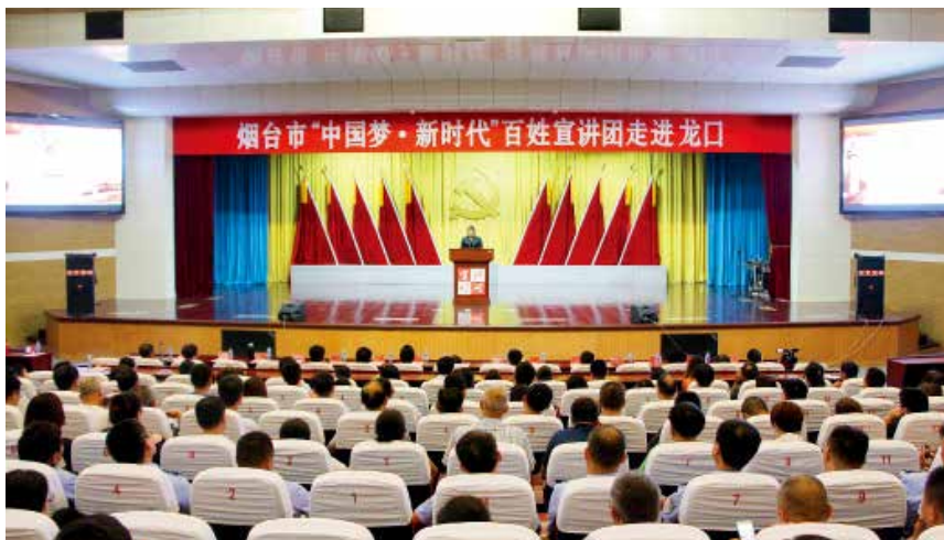
2018年8月13—17日,“中国梦·新时代”百姓宣讲团赴各县市区开展巡回宣讲活动。图为百姓宣讲团成员到龙口市开展宣讲。

周年书法、美术、摄影、歌曲等展览展示播展映活动,完成中宣部庆祝改革开放40周年百城百县百企调研,开展庆祝改革开放40周年感动烟台人物和最具影响力的事件评选活动,评选45个感动烟台人物(群体)和50件最具影响力事件并于12月20日举办发布仪式。