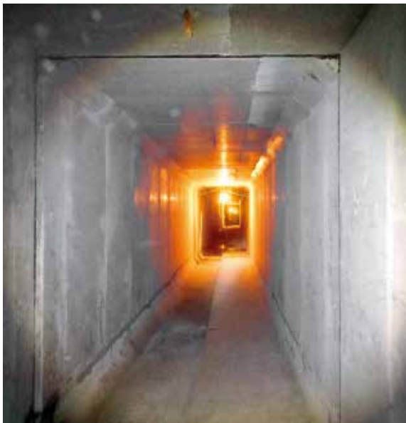
2018年7月30日，一突堤综合管廊一期主体工程完成竣工验收，标志着中心城区第一条高标准综合管廊工程正式建成。该项目于2017年7月7日开工，南起港湾大道与海港工人大道交叉口，北至海港工人大道北端，管廊总长度1.35km。包括给水、污水、燃气、热力、10kV电力及通信管线等纳入管廊。

首批山东省建筑业改革发展试点名单，9月有2个项目、11家企业获准开展第二批改革发展试点。16家企业晋升一级资质，45家企业晋升二级资质，二级以上资质企业占比首次超过50%；6家企业、10个工程项目入围省工程质量管理标准化试点；3个项目入围国家优质工程奖，获中国装饰奖工程3个，中建协QC优秀成果5个，省级优秀成果9个，省优质结构工程29项，均创历史新高；获得工程泰山杯14项、装饰泰山杯