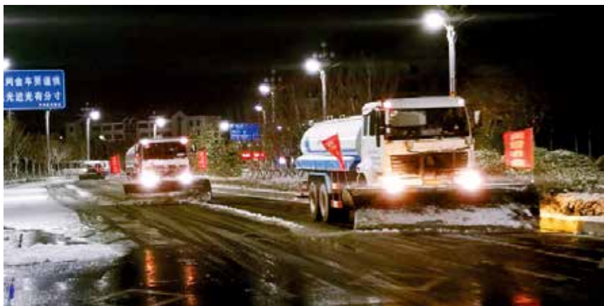
2018 年 12 月 7 日，烟台市城市管理部门机械清雪防滑作业现场。

【融雪剂严控减量】 改革道路清雪防滑作业方式，坚持“精细、减量、环保”工作理念，全部封存非环保型融雪剂，严控环保型融雪剂使用。突出主次干路、弯道、坡路等重点区域，加强调度督查，以雪为令，随下随清，保障城市交通秩序。平均每场降雪融雪剂使用量较往年减少 90% 以上。