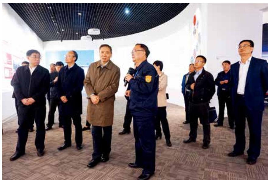
工信部副部长辛国斌到 万华化学集团股份有限公司 调研