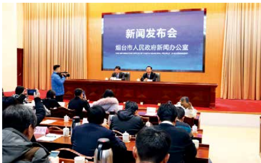
2018年12月28日，烟台市作风大改进工作领导小组办公室召开新闻发布会，向媒体通报2018年全市作风大改进工作有关情况。

【监督职责】市纪委探索“大数据+智慧纪检监察”新路子，搭建跨部门大数据研判平台，提高纪检监察工作科技化、信息化水平，系统上线以来，市纪委监委处置问题线索和立案数量同比增长168%和96%。制定出台《监督工作办法（试行）》，以政治建设、组织建设、思想建设等8个方面作为切入口，强化日常监督；在社会各界聘请50名特约监督员，拓展监督渠道、提升监督实效。发挥巡察作用，市级先后组织4轮常规巡察、3次专项巡察、1次机动巡察、2次“回头看”，发现重点问题850个、问题线索321起。强化派驻监督，研究制定加强派驻机构工作考核等7项制度，以制度化、规范化强化派驻权威、提升派驻实效，派驻监督实现重大突破，受理各类问题线索667起，