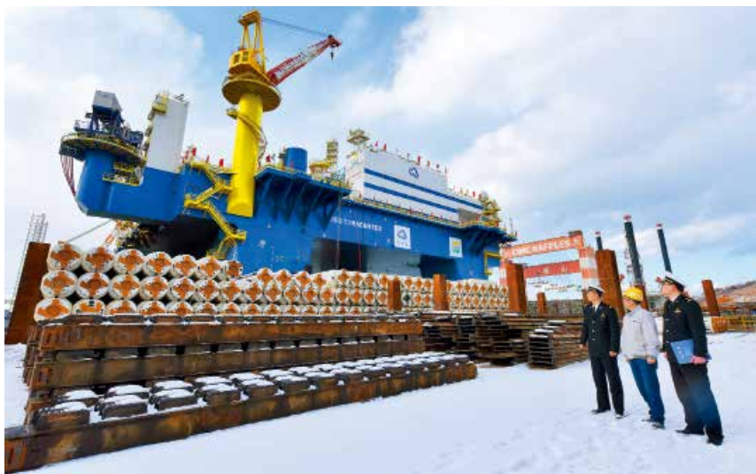
2018年2月5日，烟台海关关员在钻井平台建造场地现场监管。

【进出口贸易秩序维护】 狠抓源头管理和口岸把关，强化进口废物原料收货人注册登记管理。从严执行进口废物原料检验检疫法规标准，强化进口废物原料风险预警管理，落实口岸分类风险预警措施，坚决拒“洋垃圾”于国门之外。开展“蓝天2018”及“国门利剑2018”专项行动，从多个缉私重点领域重拳出击，战果丰硕。强化知识产权海关保护，严厉打击侵权假冒违法进出口行为。