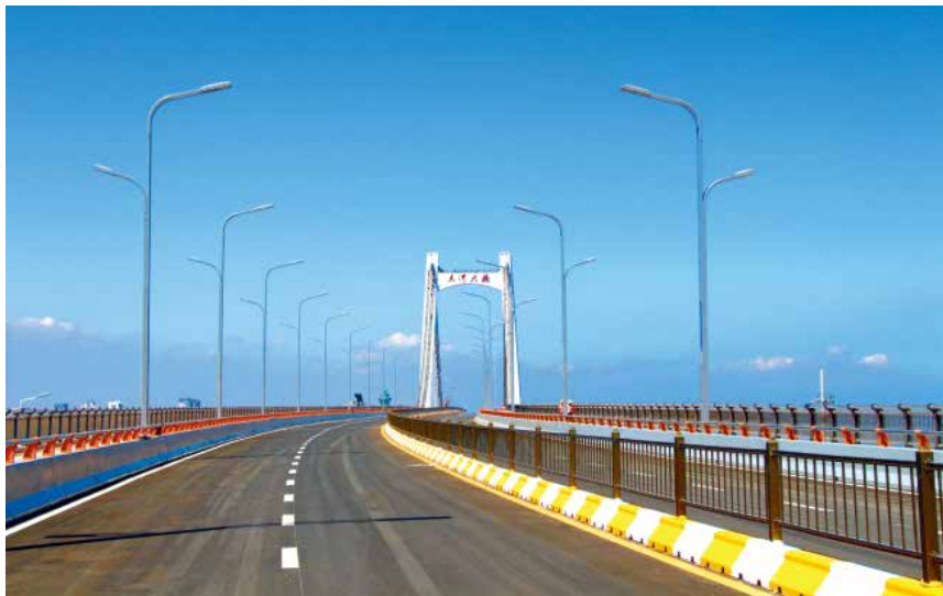
2018 年 8 月 1 日,滨海西路及夹河桥工程全面通车,夹河桥成为国内首例通车运行的独塔双跨自锚式悬索桥,入围中国钢结构金奖评选名单。

【村镇建设】 省政府授予烟台市“山东省适宜人居环境奖”称号,16 个小城镇入选全国千强镇、连续两年居全省第一,4 个美丽村居跻身首批省级试点,8 个村入选第五批中国传统村落公示名单,省级宜居镇、宜居村庄分别新增 3 个、8 个。农村人居环境建设方面,改厕完成 5 万户,清洁取暖完成 3.1 万户,危房改造完成 1451 户,建制镇生活污水处理设施开工建设 9 处。