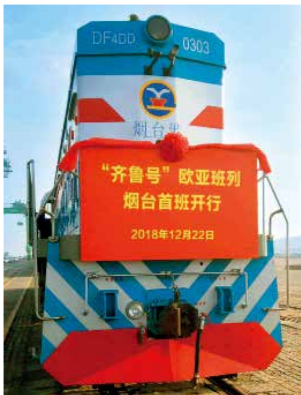
2018年12月22日,“齐鲁号”欧亚班列烟台首发仪式在烟台港集装箱码头举行。