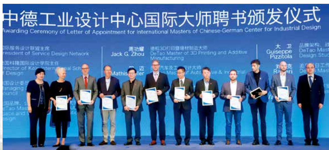
中德工业设计中心国际大师聘书颁发仪式