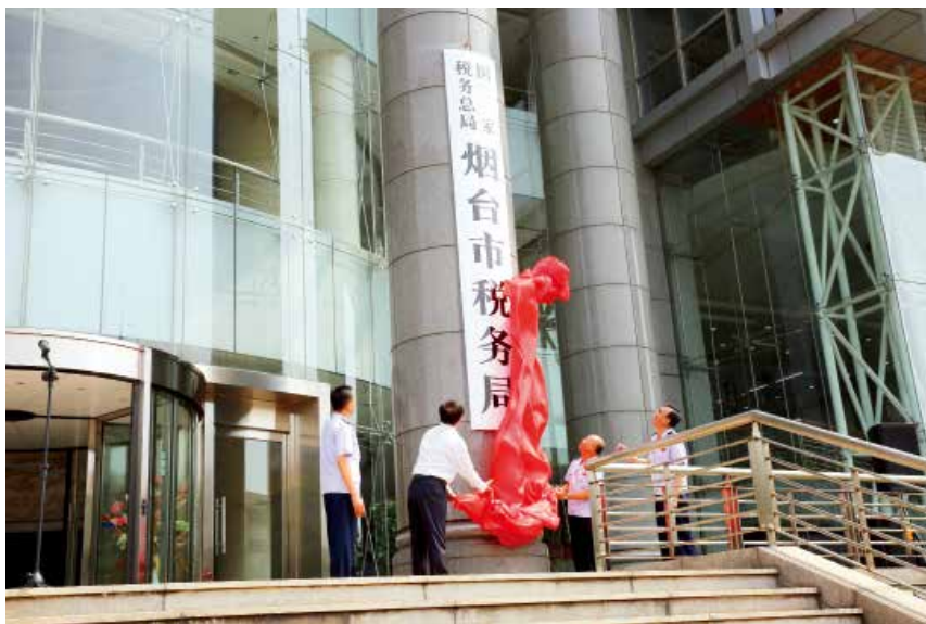
2018 年 7 月 5 日，国家税务总局烟台市税务局挂牌。

【税收征管】 全市税务系统加快税收治理体系和治理能力现代化进程，以扁平化、集约化、专业化管理为导