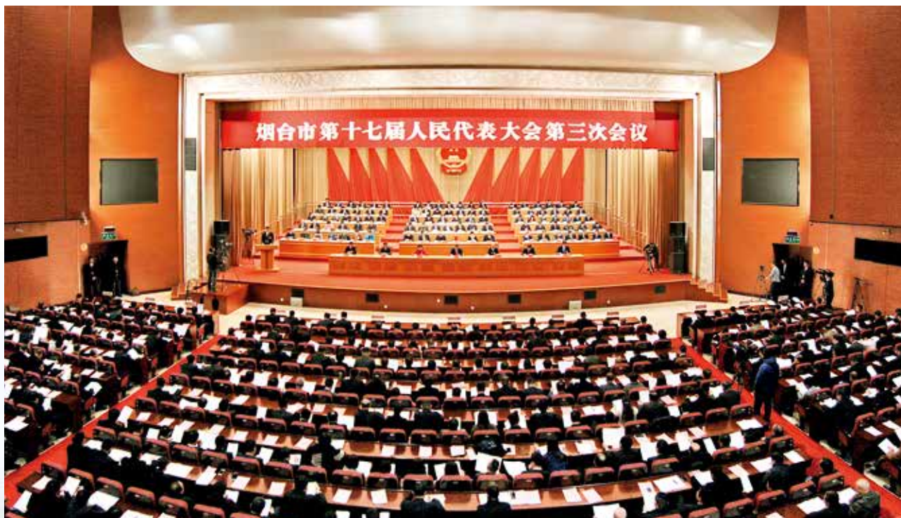
2019年1月16日，烟台市第十七届人民代表大会第三次会议开幕。