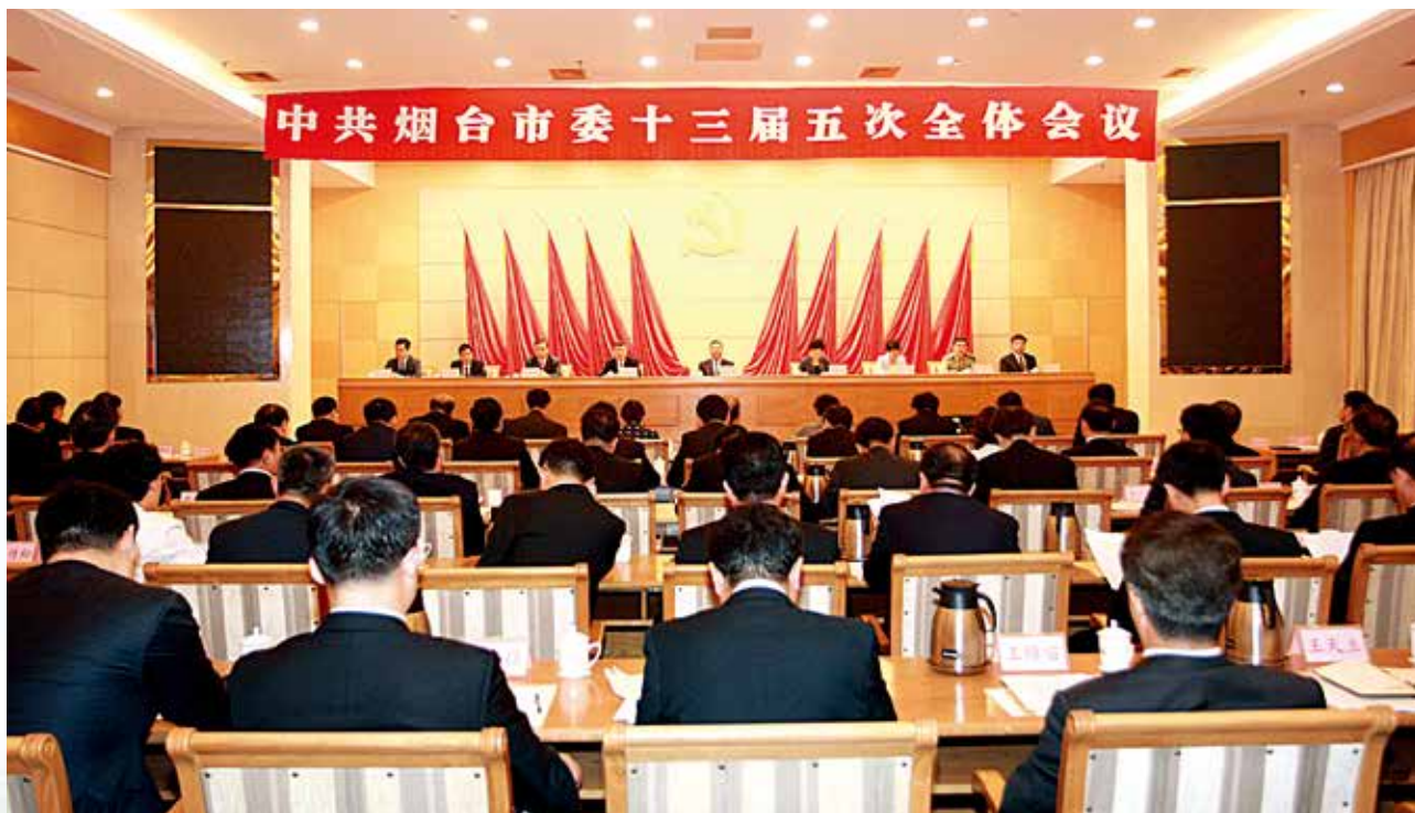
2018年6月26日，中共烟台市委十三届五次全体会议举行。

全会以习近平新时代中国特色社会主义思想为指导，全面贯彻落实党的十九大精神，深入学习贯彻习近平总书记视察山东重要讲话、重要指示批示精神，审议通过《中共烟台市委关于深入学习贯彻习近平总书记视察山东视察烟台重要讲话精神的意见》。