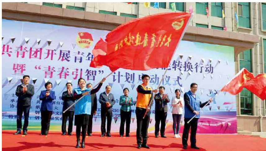
2018年4月17日,由团市委主办的开展青年建功新旧动能转换行动暨“青春引智”计划启动仪式举行。

野的青年人才。完善公共服务供给。实施新兴青年群体“筑梦计划”,依托“烟青e家”“青社学堂”,开展职业导航,进行梦想孵化,举办“新文艺青年海岛音乐节”等活动,激发新兴青年群体创造力。实施关爱贫困弱势青少年群体公益项目,推进“青春银行”“聚才圆梦”“心愿直通车”等项目,募集物款320万元,资助大中小1527人。打造“青心烟台”婚恋交友服务品牌,组建青年交友微信群、QQ群,为青年婚恋交友提供必要的基础保障和适合青年特点的便利条件。维护青少年合法权益,深化“共青团与人大代表、政协委员面对面”活动,选配青少年事务助理,开展青少年模拟法庭,拓宽青少年利益诉求表达渠道,构建未成年人犯罪预防帮教体系。完善驻烟高校反诈骗联席工作会议机制,15万名在校学生参与防范电信网络诈骗调查问卷,提