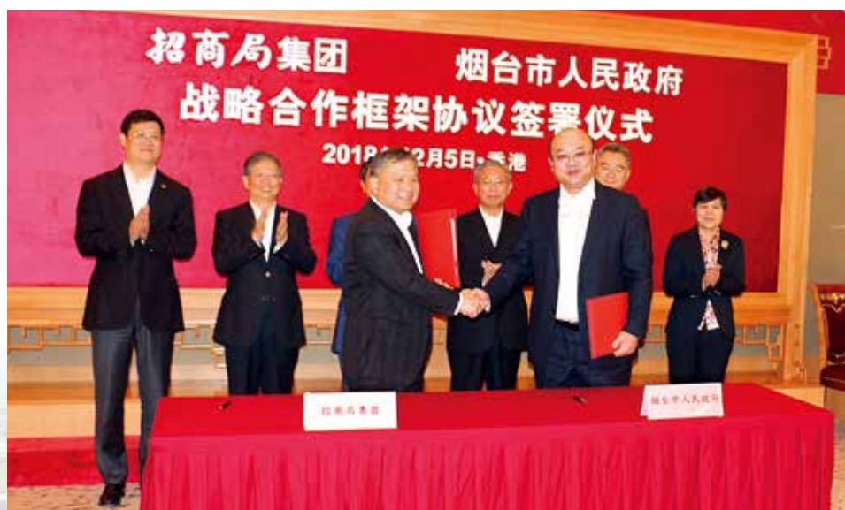
烟台市政府与招商局集团签署战略合作协议