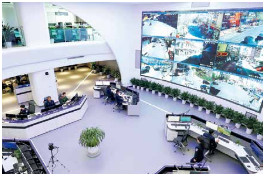
烟台市公安局“大数据合成研判作战中心”

【实战工作】 市公安局建成市局大数据合成研判作战中心，刑侦、技侦、网安、情报等部门队建制入驻。启动警情“三清”工作，全市受理有效警情全部清零；信访初访总量同比下降51%；网上涉警投诉环比下降31.8%；没有发生因执法问题引起的公安行政复议和行政诉讼案件。及时调度、妥善处置高新区“3·11”校园寻衅滋事、芝罘“6·25”危害公共安全等87起敏感案事件。应用大