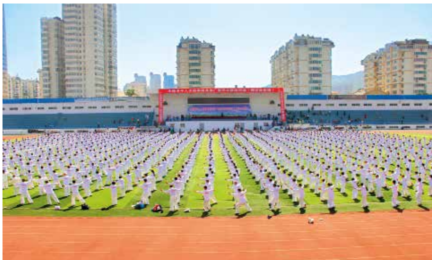
2018 年 5 月 19 日，全国老年人太极拳推广展示联动活动（烟台分会场）在芝罘区人民体育场举行。

【教科文卫体】 2018 年底，全区有普通高等院校 1 所，在校生 3 万人。中等技术学校 5 所，职业高中学校 1 所，附设中职班 2 所，共有在校生 0.97 万人。十二年一贯制学校 2 所；高级中学 1 所；完全中学 6 所；九年一贯制学校 7 所；初级中学 12 所；小学 40 所；特殊教育学校 2 所。普通高中在校生 1.41 万人；初中在校生 2.87 万人；小学在校生 4.28 万人；特殊教育在校生 0.03 万人。取得市（地）级以上各类重要科技成果 6 项，其中，获得省科技奖励 1 项。专利申请 2769 件，授权专利 1288 件。有文化馆 1 处，公共图书馆 1 处，文化馆 1 处，公共图书馆 1 处，档案馆 1