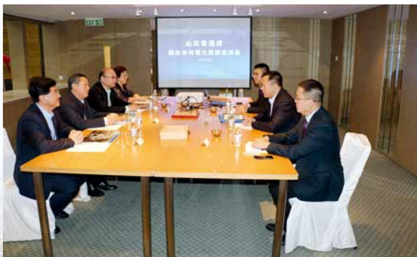
烟台市与恒大集团座谈会