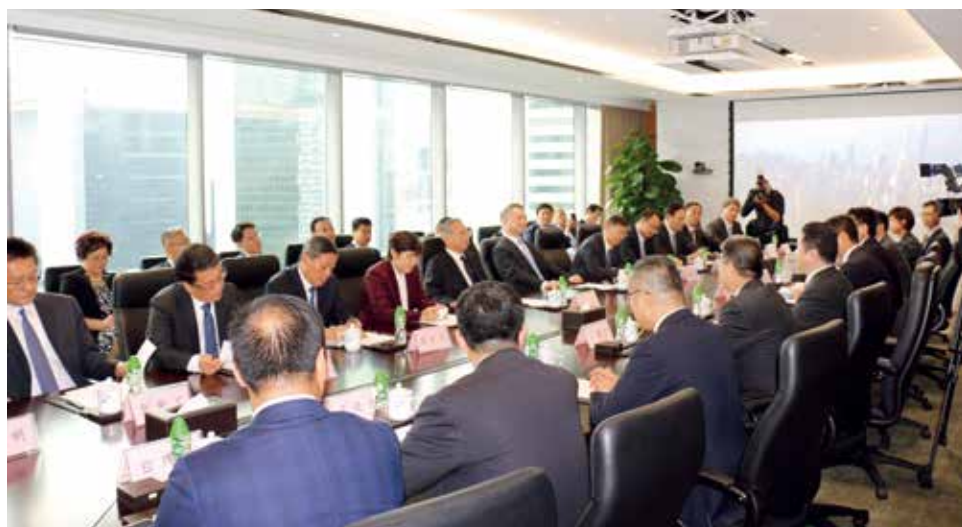
烟台市领导参加全省与华润集团、招商集团等战略合作工作会谈