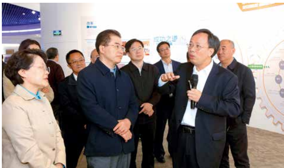
2018年10月12日，国务院国资委副主任翁杰明出席在万华化学集团召开的工业类“双百企业”现场交流会并参观万华烟台工业园展厅。

2018年10月12日，国务院国有企业改革领导小组办公室在烟台市召开工业类“双百企业”现场交流会，组织全国80家工业类“双百企业”到万华化学集团调研，向全国推广万华改革经验。万华化学集团介绍了企业改革创新40年来的经验做法。会前，入选“双百行动”的80家工业类企业负责人和国企改革有关专家学者参观了万华烟台工业园展厅和中央控制室及园区。