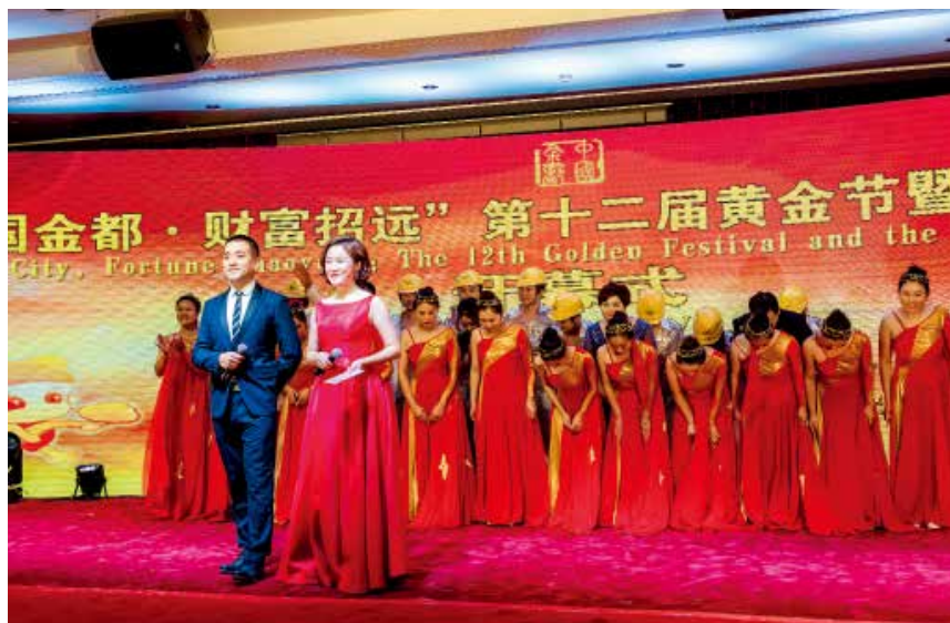
2018年8月27日，金都招远第十二届黄金节暨第二届网络黄金节开幕。

全国中小城市科技创新评价指标体系包含四个指标：“双创”平台建设、研发潜力、科技创新活力、科技创新成效。招远市实施创新驱动发展战略，完善区域创新体系，增强科技创新供给能力，助力新旧动能转换。建有山东省级工程技术研究中心6家、企业重点实验室2家、院士工作站5家，与著名高校共建新型研发