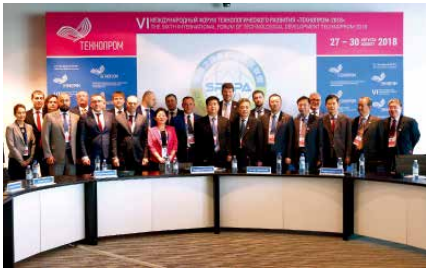
2018年8月29日至9月4日，丝绸之路高科技园区联盟第三次会议在俄罗斯新西伯利亚举行。

技改项目16个，新增各类平台27个。政策体系全面优化，出台产业项目引育办法、“双招双引”工作意见等文件。