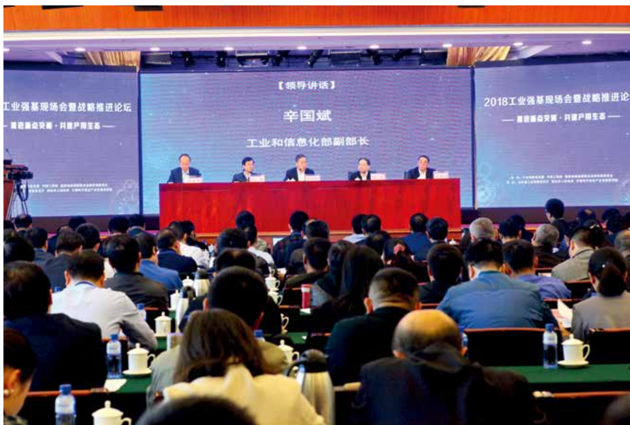
2018 年 10 月 25 日，国家工业强基现场会暨战略推进论坛在烟台市举行。

2013—2018 年，烟台市获批工业强基工程项目 6 项，获得中央预算内财政补贴 11475 万元。