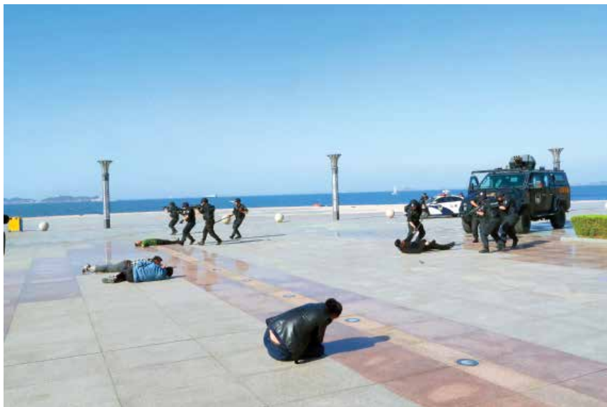
2018年5月18日，烟台市公安局举行“利剑—2018”反恐演习。

【道路交通管理】 确定市级事故多发点段10处，全部抄告责任部门限期责令整改。对“涉酒涉毒”“三超一疲劳”“涉牌涉证”等严重违法行为零容忍、上限处罚、常态严管，直属大队全年查处交通违法行为130万起，其中涉牌涉证1.3万起、超载2973起、酒驾1667起、醉驾436起，行政拘留421人、刑事拘留366人。重点车辆检验率、报废率达100%。文明交通进驾校“五个一”活动在全市77家驾校铺开，15万名驾校学员受到教育。调整优化市区98所中小学、60处重要路口、4个老旧小区交