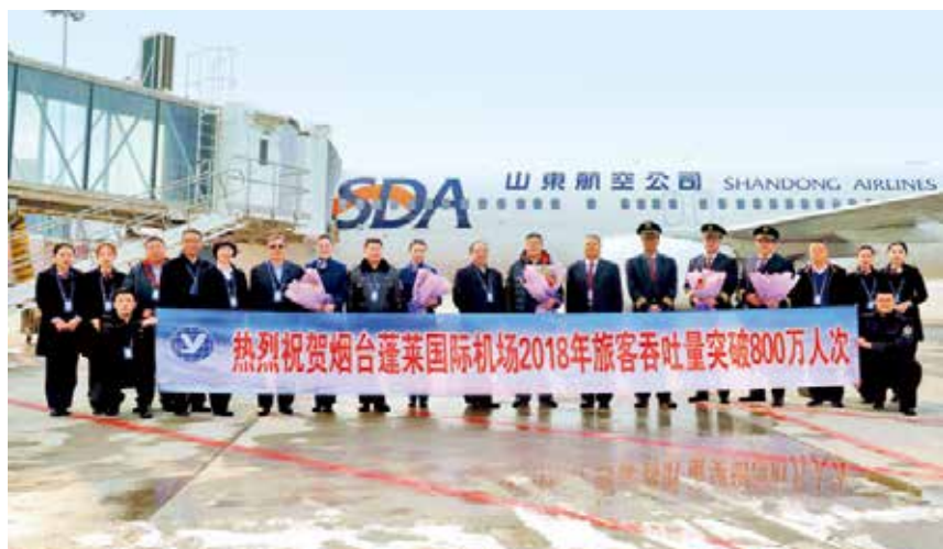
2018 年 12 月 10 日，烟台机场年旅客吞吐量突破 800 万人次。

【服务社会】 2018 年，全市国资企业全年实现社会贡献总额 398 亿元、同比增长 8.6%，吸纳就业 5.2 万人、上缴税金 99 亿元、职工薪酬 77 亿元。烟台港完成货物吞吐量 3.2 亿吨、增