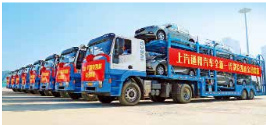
2018 年 6 月 20 日，东岳别克凯越整装待发。

科技创新。全年财政性科技投入 12.6 亿元，占一般公共预算支出的 15.2%。新增高新技术企业 50 家，累计 158 家。新增省级以上企业技术中心 8 家、市级 9 家，累计国家级 5 家、省级 25 家、市级 27 家。新增市级工程技术研究中心 2 家，累计国家级 2 家、省级 16 家、市级 16 家。新增省级工程实验室 2 家、市级 2 家，累计国家级 1 家、省级 10 家、市级 12 家。新增山东省院士工作站 4 家，累计 11 家。国家备案科技型中小企业 193 家。全年新获国家技术发明二等奖 1 项；新获山东省科学技术奖 3 项，其中科技进步一等奖 2 项、技术发明二等奖 1 项。全年发明专利申请量 1586 件，发明专利授权量 307 件。全年国际专利申请量（PCT）20 件，