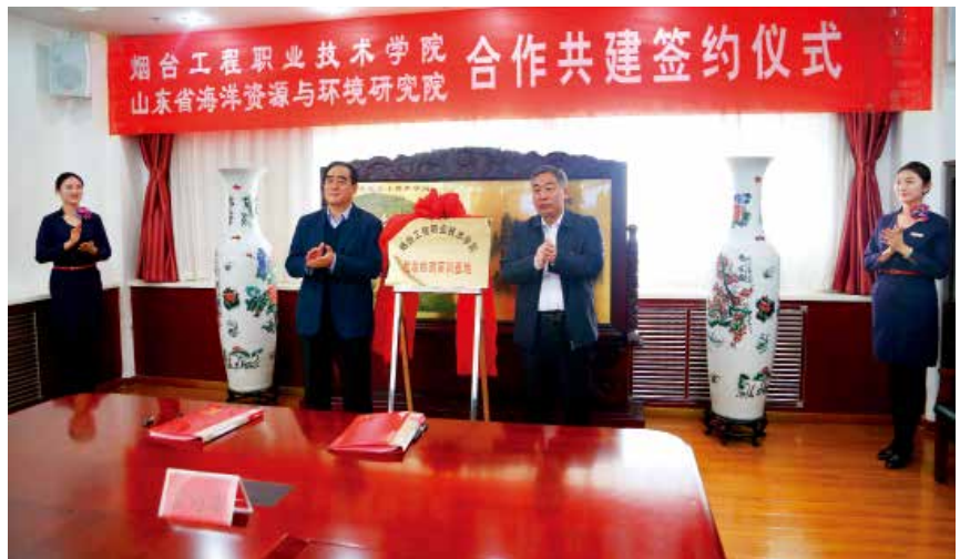
2018 年 12 月 27 日，烟台工程职业技术学院与山东省海洋资源与环境研究院举行合作共建签约仪式。

【烟台汽车工程职业学院】 学院占地 75 公顷，建筑面积 30.5 万平方米，教职工 746 人。全日制在校生 1 万余人。设有汽车制造工程系等 7 个教学系部，开设汽车制造与装配技术等 34 个专业。学院建有 3.5 万平方米的实训中心，校内实训室 124 处，校外实训基地 250 处。学院先后与北京现代、博世、一汽大众、金岭汽车、巴斯夫、保时捷、戴姆勒、捷豹路虎等 42 家汽车行业龙头企业建立深度校企合作关系，建立定向班、冠名班。全院立项课题 35 项，其中国家级课题 19 项，省级课题 6 项，市级 10 项。获得国家级科研成果一等奖 4 项；省级教科研成果一等奖 1 项，二等奖 4 项，三等奖 6 项；其他教育科学研究