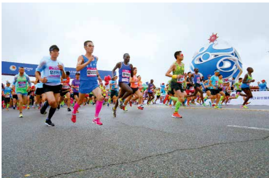
2018 年 7 月 1 日，2018 潍柴动力·仙境海岸海阳国际马拉松开赛。

【2018 国际排联世界沙滩排球巡回赛海阳公开赛】 7 月 18—22 日，2018 国际排联世界沙滩排球巡回赛海阳公开赛在海阳举行。本次比赛由国际排联、中国排协、山东省体育局主办，是本赛季巡回赛年终总决赛之前的三星级以上赛事。25 个国家和地区的 71 支队伍参赛。奥地利选手获得