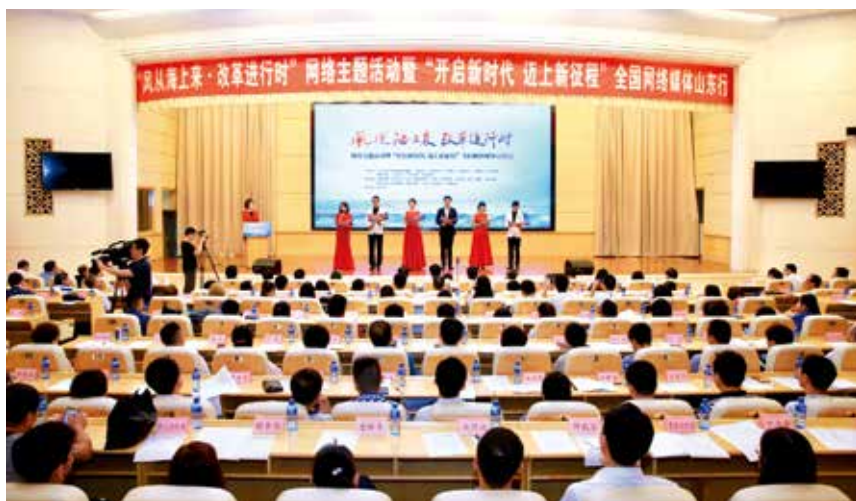
2018 年 7 月 16 日，“风从海上来·改革进行时”网络主题活动暨“开启新时代 迈上新征程”全国网络媒体山东行活动在烟台启动。

【党外代表人士队伍建设】市委统战部首次将党外干部培训班等 5 个班次纳入市社会主义学院主体班次，将非公有制经济人士年青一代培训班等 4 个班次纳入专题班次。加强党外代表人士实践锻炼基地建设，省级基地龙头示范、市级基地承传衔接、县级基