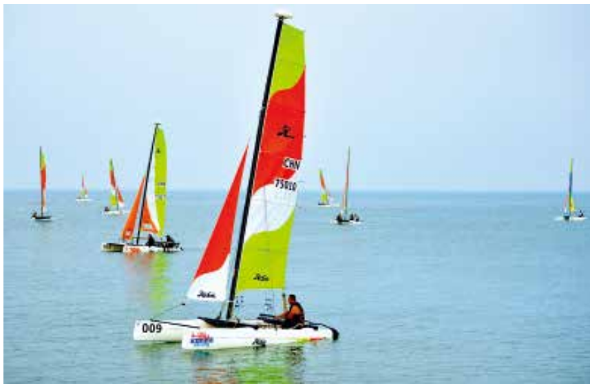
2018 年 9 月 28 日，首届长岛“天海风”摩托艇、帆船赛举办。

【贸易 旅游】 全年实现社会消费品零售总额 24.7 亿元，比上年增长 7.5%。其中，城区市场实现零售额 17.3 亿元；农村市场实现零售额 7.4 亿元。实现外贸进出口总额 35015 万元，增长 22.8%，其中出口 24777 万元，增长 15.4%。实际利用外资 198 万元。主要旅游景点有烽山、林海、仙境源、月牙湾、九丈崖。全年接待