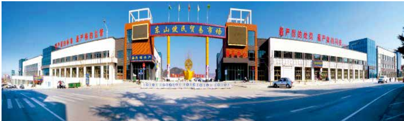
2018年9月4日,栖霞市东山便民贸易市场开业。

6月15日,“梦金园”杯首届栖霞市“我爱我家”社区(村居)文化节启动仪式在市文化广场举行,主题