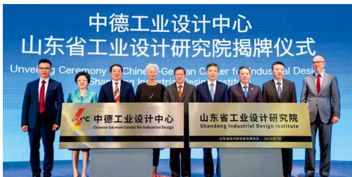
中德工业设计中心、山东省工业设计研究院揭牌仪式