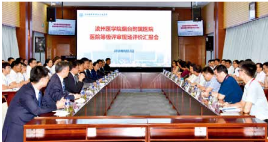
2018 年 8 月 13 日, 滨州医学院烟台附院举办医院等级评审现场评价汇报会, 获批省属三级甲等综合医院。

学校形成“一优两特”办学格局。有国家级特色专业 4 个、省级应用型专业群 4 个、省级特色专业 8 个、省部级重点学科 8 个, 其中, 临床医学入选“山东省一流学科”建设名单、进入 ESI 全球排名前 1%, 获批为山东省新旧动能转换专业对接产业项目。立项国家自然科学基金立项 18 项, 获各类科研奖励 138 项; 免疫学研究团队在顶尖学术期刊《Nature》杂志发表研究论文。1985 年在全国最早创办残疾人高等教育, 构建“残健融合、教康结合、学用合一”的残疾人人才培养“滨州医学院模式”。构建融合多学科门类的“大康复”体系, 成为山东省首家拥有覆盖临床康复、物理康复、作业康复、护理康复、假肢矫形、辅助器具、康复管理等“大康复”学科专业体系的高校, 是全国首批、全省唯一获批康复治疗学硕士学位授权点的高校, 是全国最