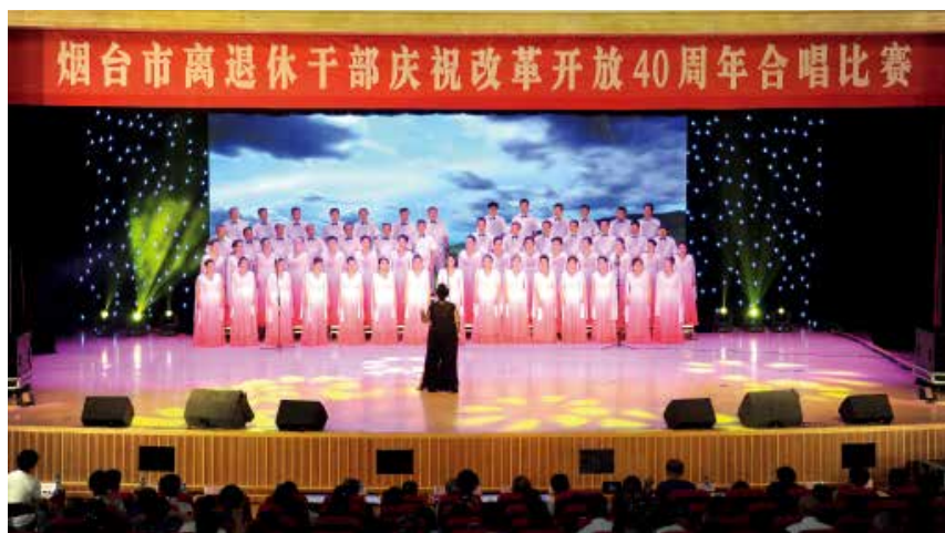
2018年8月15日，烟台市举办离退休干部庆祝改革开放40周年合唱比赛。

【组织建设】市委老干部局制定下发离退休干部党组织领导班子换届选举，离退休干部党支部收缴、使用、管理党费和离退休干部社团党建等意见，推进离退休干部党建工作制度化、规范化。启动“离退休干部党建示范点”创建工作，为各级离退休干部基层党组织建设提供样板。烟台依托社区党群服务中心设立离退休人员党建工作站等做法，得到省委老干部局