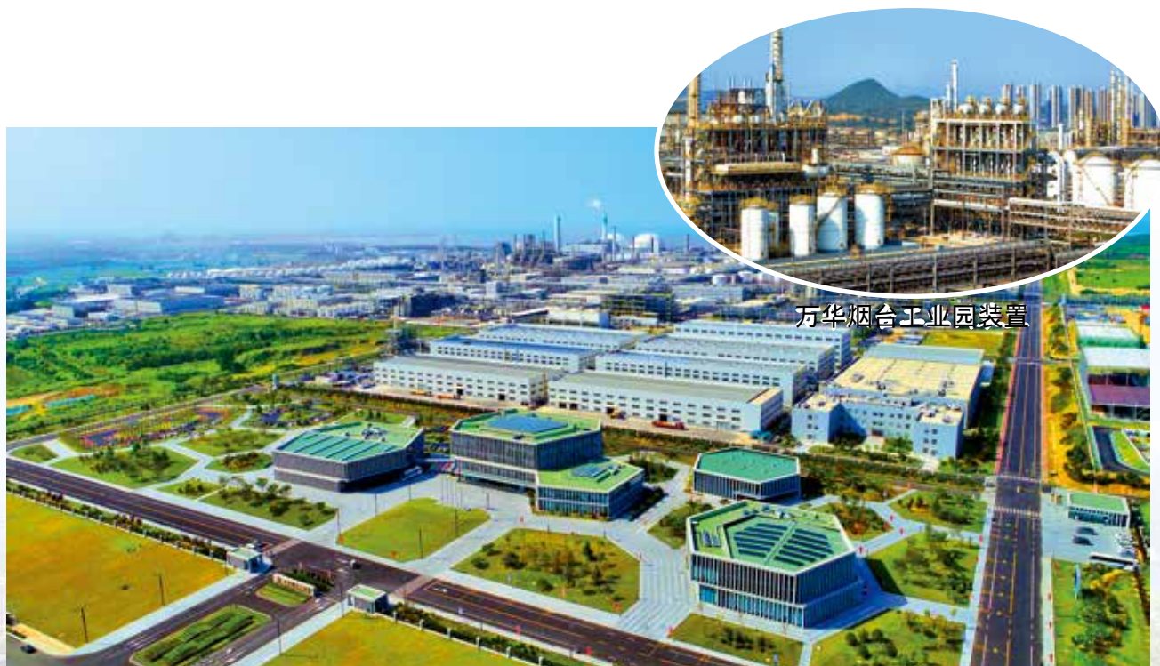
万华烟台工业园装置