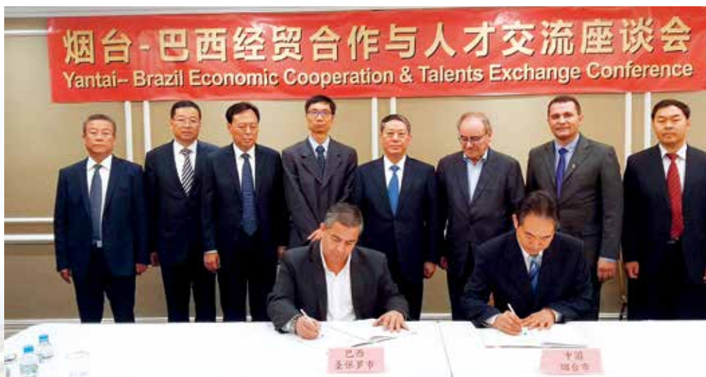
烟台市与圣保罗签署友好合作城市意向协议