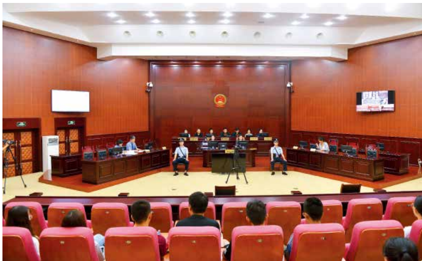
2018 年 6 月 28 日，烟台中院公开审理全省首起侵犯烈士名誉权公益诉讼案。