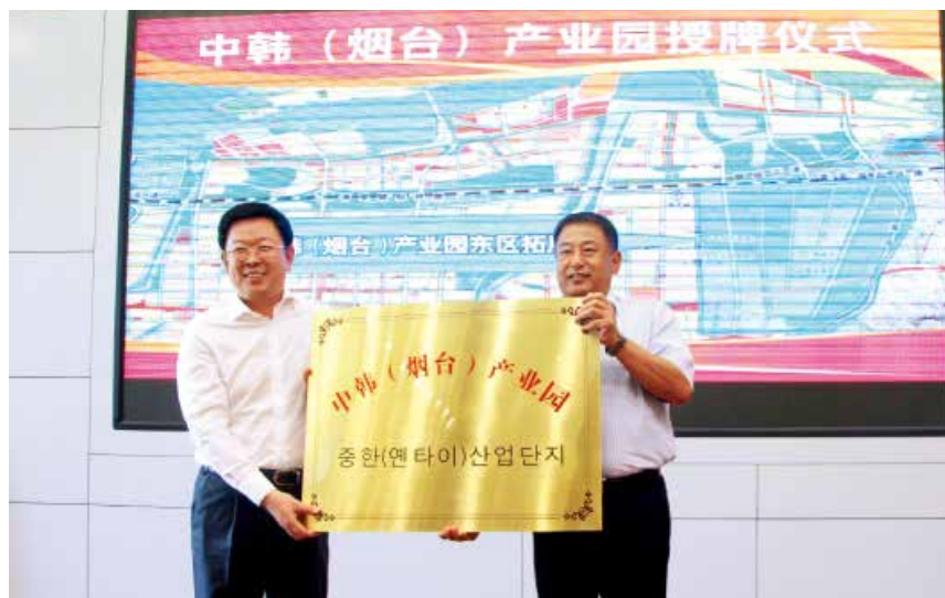
2018年9月17日,中韩(烟台)产业园拓展区东区在牟平区挂牌成立。