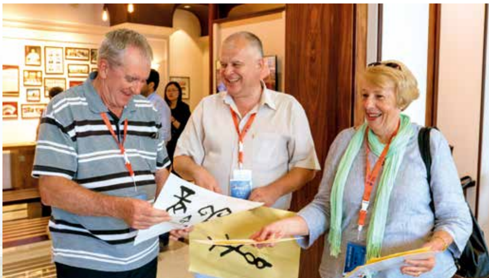
外宾到老年大学交流