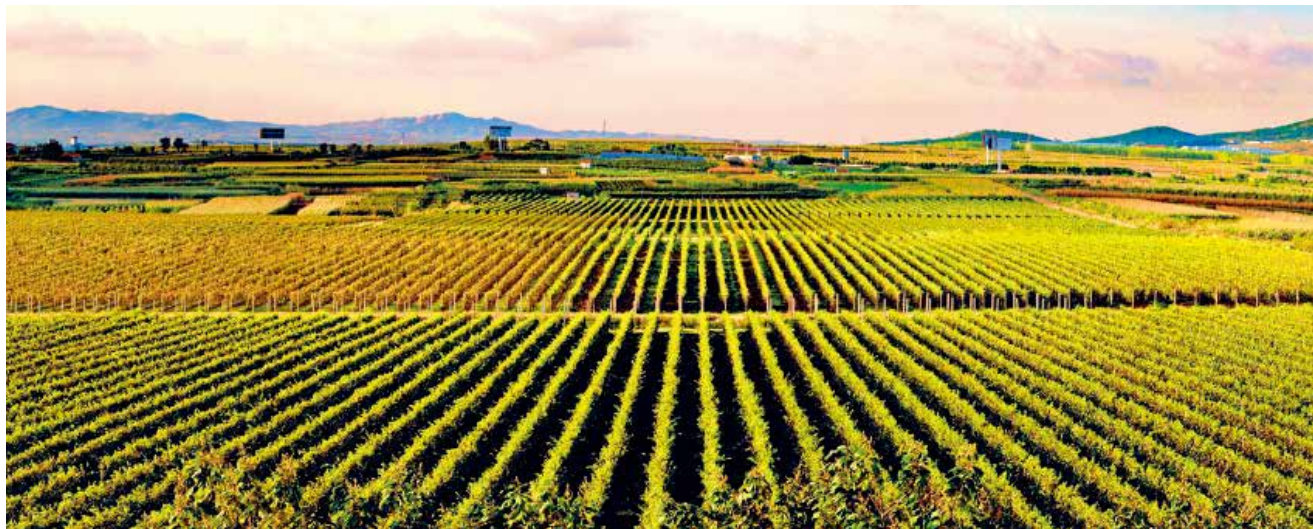
海岸葡萄基地

【优化发展环境】“烟台中小企业网”和《烟台日报》开辟专栏，及时宣传解读各级促进中小企业、民营经济发展的决策部署和政策措施；举办全市中小企业融资与财务管理培训班两期，参加人员400余人。市财政局落