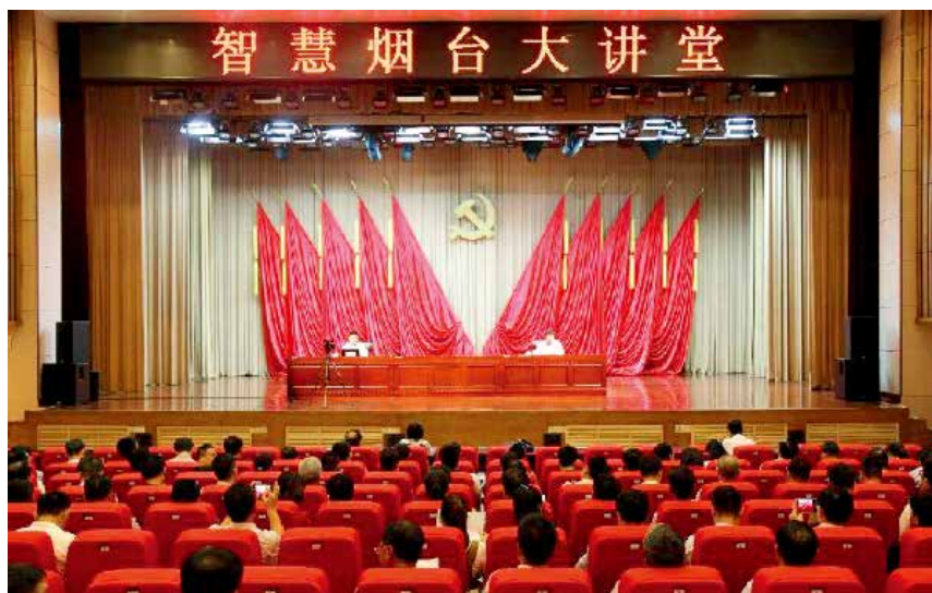
2018 年 9 月 13 日上午,第 43 期“智慧烟台大讲堂”在市委党校举办。

【业务指导】 协助省委党校开展“2+1”牵手计划活动。召开全市党校工作座谈会。完成“党委落实办党校管党校建党校主体责任情况”考核任务。根据市考核办反馈 2017 年全省经济社会发展综合考核结果,党校负责的