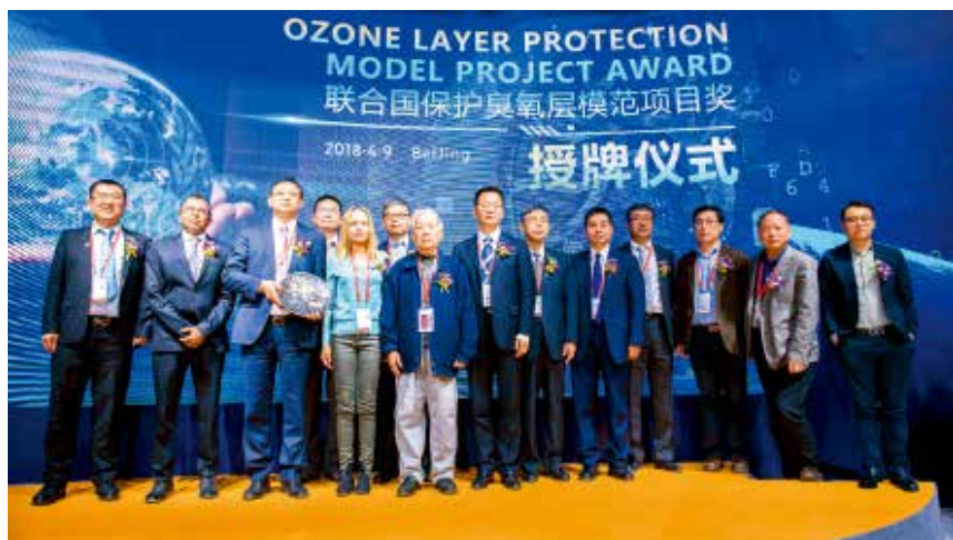
2018 年 4 月 9 日，冰轮环境获颁联合国“保护臭氧层模范项目奖”。

奖”(全球共 5 家)，连续 14 年入选中国机械工业百强企业，是全国制冷空调行业唯一入选企业。万华、张裕、北极星、东方电子、泰和新材 5 家市管企业被评为“山东百年品牌重点培育企业”。泰和新材获批商务部国家外贸转型升级基地，交运集团入选中国道路运输百强诚信企业。