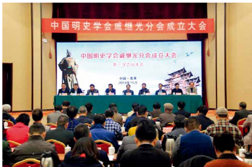
2018 年 11 月 8 日，中国明史学会戚继光分会成立。

【中国明史学会戚继光分会成立】 11 月 8 日，中国明史学会戚继光分会在蓬莱正式成立。戚继光分会作为中国