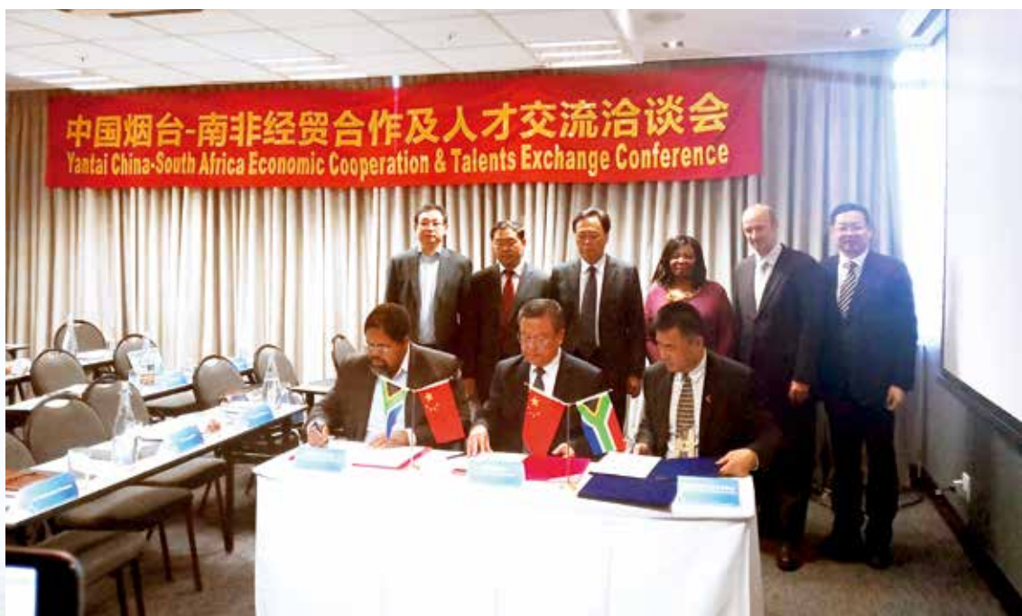
中国烟台—南非经贸合作项目签约