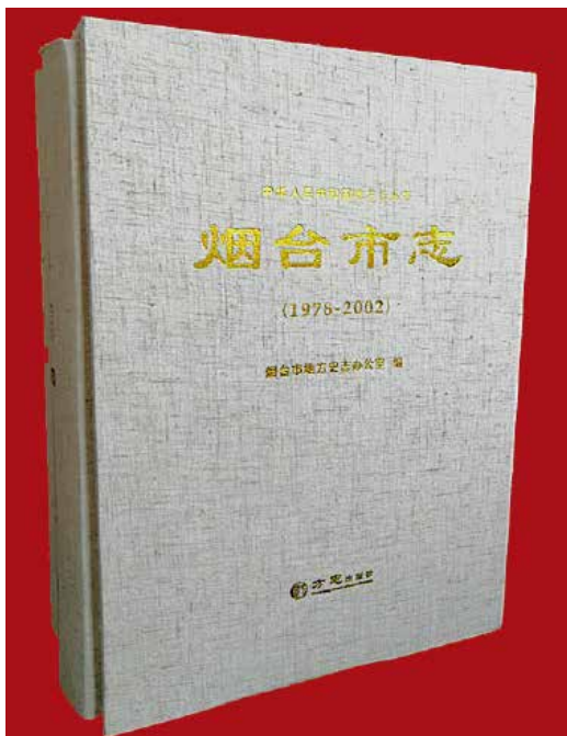
2018年12月,《烟台市志(1978—2002)》出版。

供全方位的服务。志稿经过多轮评议、反复修改,形成观点正确、体例完备,结构严谨,内容全面、记述规范、装帧精美、时代与地域特色鲜明的地方百科资料全书。2017年12月18日,《烟台市志(1978—2002年)》专家评审会在东山宾馆召开。之后组织人员又对志稿进行10余轮修改,2018年12月正式交付印刷出版。