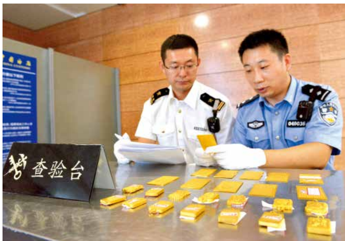
2018年9月28日，烟台海关查获走私黄金制品。

体通关时间三分之一的目标任务。深化“三互”大通关建设，协助烟台口岸办推动国际贸易“单一窗口”标准版推广应用工作，货物申报等主要业务应用率实现100%。启用“查验智能调箱系统”，推广先期机检、集中审像等改革，提高港口监管的集成化、智能化水平。继续协助落实查验配套费用改革。在烟台保税港区复制推广26项自贸区创新监管制度；助力烟台回里保税物流中心（B型）成功获批，成为青岛关区首家B型保税物流中心。支持烟台“齐鲁号”欧亚班列正式开通运营。落实“大进大出”战略，指导烟台海空港新获批进境食用水生动物指定口岸资格，支持