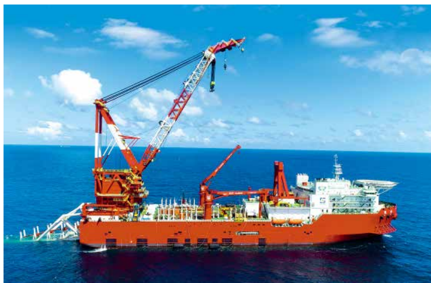
5000吨起重铺管船——“德合”轮

加强快递市场监管,开展日常执法检查和专项检查,对发现的违法行为和问题严肃依法查处,处罚企业34起、罚款金额15万元,约谈16家,责令改正10家,停业整顿12家。深化“放改服”改革,压缩审批时限,全面推动许可企业信息公开,全年完成11家企业的许可申请指导,48