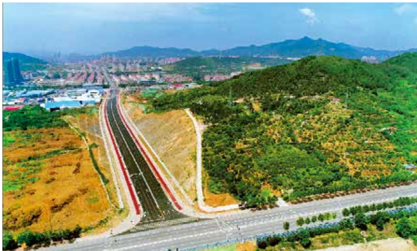
2018 年 8 月 9 日,塔山南路道路第一标段——机场路至通世南路段正式通车。

【城市建设】 2018 年,烟台市住建系统组织开展“百日攻坚”活动,加快突破征收、资金、手续梗阻制约。塔山南路工程,道路标段全部完成竣工验收,其中外夹河桥—冰轮路段、机场路—通世南路段 2 个路段通车运行;通世南路以东 4 个隧桥标段完成总工程量 40% 以上,通世南路至胜利南路隧道提前 3 个月贯通;跨蓝烟铁路桥完成施工单位招标并进场施工。一突堤综合管廊一期工程通过竣工验收,中心城区第一条高标准综