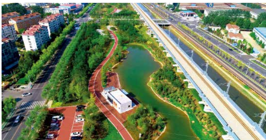
烟台经济开发区改造后的柳子河公园