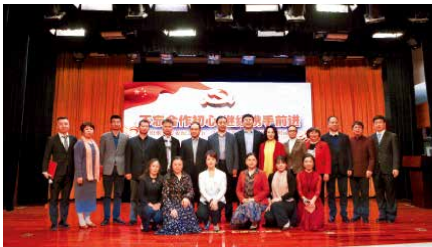
2018年4月26日,民盟烟台市委举办不忘合作初心继续携手前进——纪念“五一口号”70周年诗朗诵会。

【助力乡村振兴】 “中国民主同盟烟台市委委员会龙泉同心实践基地”建设有序开展。2月,组织医疗专家和旅游环境设计、项目策划方面的专家,到基地对接工作;4月,开展医疗农技和文化进龙泉系列活动。