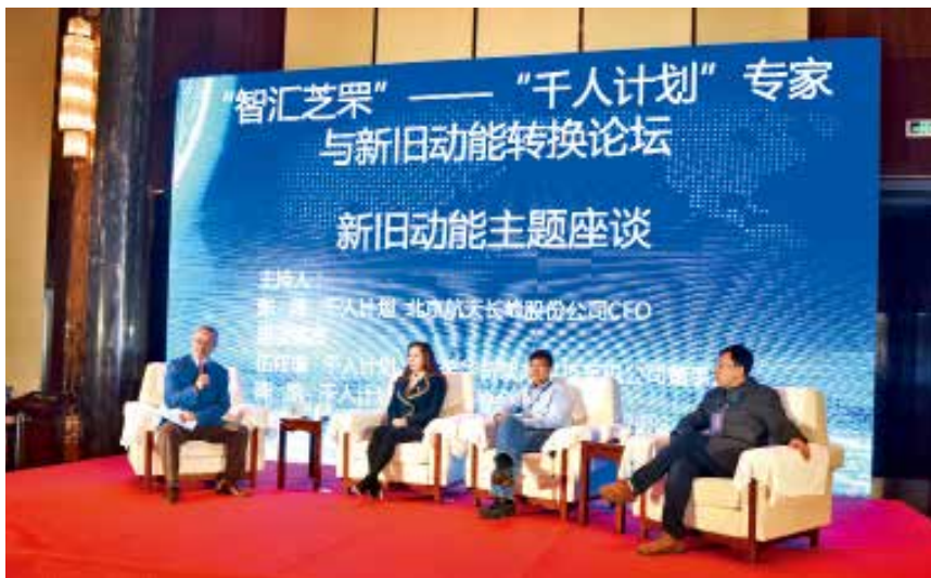
2018 年 3 月 30—31 日，芝罘区举办“智汇芝罘”——“千人计划”专家与新旧动能转换论坛。

【第四届中国人力资本论坛（烟台站）举办】9 月 7 日，由芝罘区委组织部、芝罘区人社局联合主办的第四届中国人力资本论坛（烟台站）在烟台举办，这也是国内人力资源行业规格最高、最具权威性的领袖级峰会第