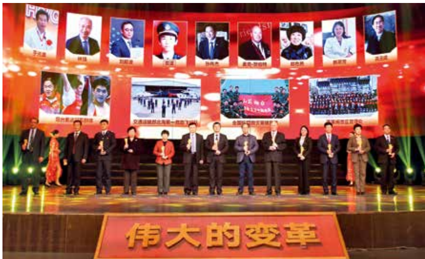
2018年12月20日,庆祝改革开放40周年感动烟台人物和最具影响力的事件发布仪式举行。

【意识形态工作】 市委常委会两次专题研究意识形态工作,召开两次市委意识形态和宣传思想工作领导小组会议,研究分析意识形态领域工作。建立完善意识形态有关制度,召开会商研判会议、座谈会、工作推进会,出台责任清单和负面清单,在党内通报2次工作情况。对哲学社会科学报告会、研讨会、讲座、论坛进行审批备案,对阵地管理漏洞进行排查整改。