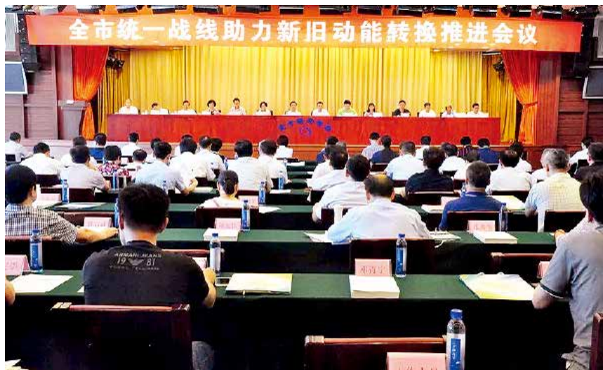
2018年9月11日，全市统一战线助力新旧动能转换推进会议召开。