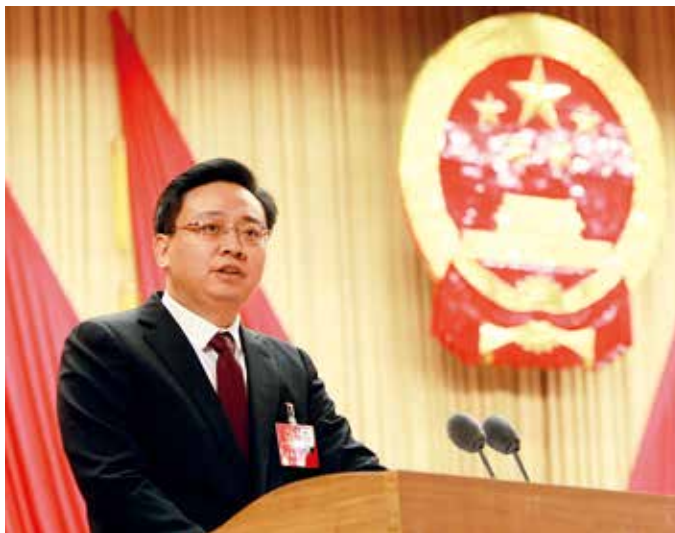
代市长陈飞在烟台市第十七届人民代表大会第三次会议上作政府工作报告

2019年1月16—19日，烟台市第十七届人民代表大会第三次会议举行。大会执行主席张术平、王晓敏、刘洪波、张伟、潘士友、黄永政、牟强及443名代表出席会议。王晓敏主持会议。代市长陈飞作政府工作报告。会议经过无记名投票，补选陈飞为烟台市人民政府市长。